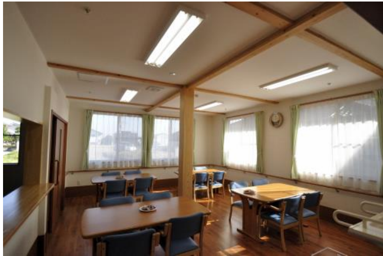
★レクリエーションルームに変身する居間・食堂★