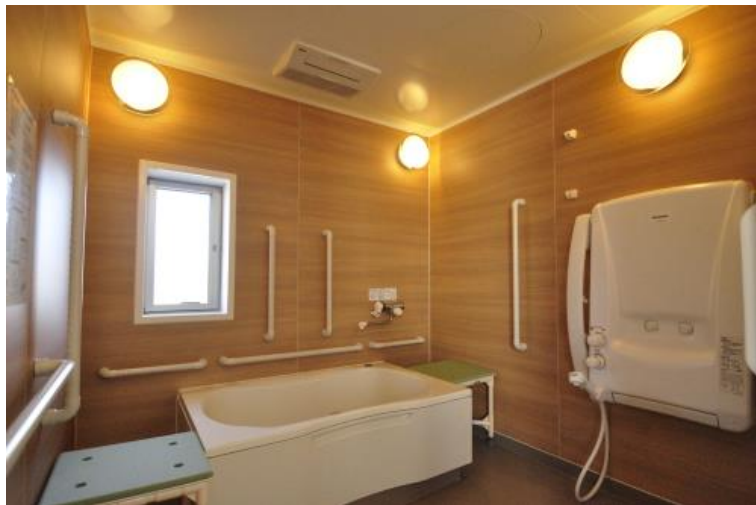
★明るくて広い介護浴槽ですシャワー浴もできます★