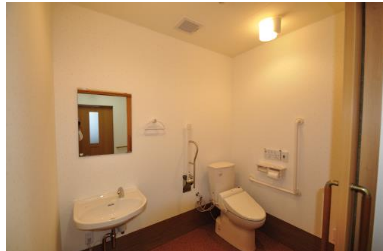
★広い介護用の共用トイレ★

居間はカラオケをしたり、絵を書いたり、趣味のスペース！ トイレにもお風呂にもナースコールが付いていますから安全です！ 広い脱衣場(8畳)には冷暖房完備！